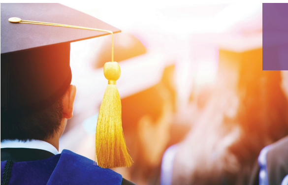
Multiple Professional Certifications