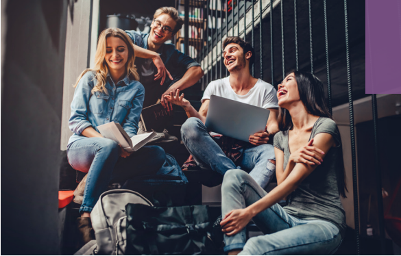
Internships and corporate experience