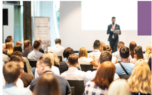
Unique Learning Experience