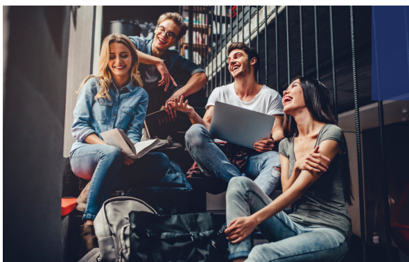
Tronc commun riche et diversifié

Nous vous accompagnons dans le choix de votre parcours