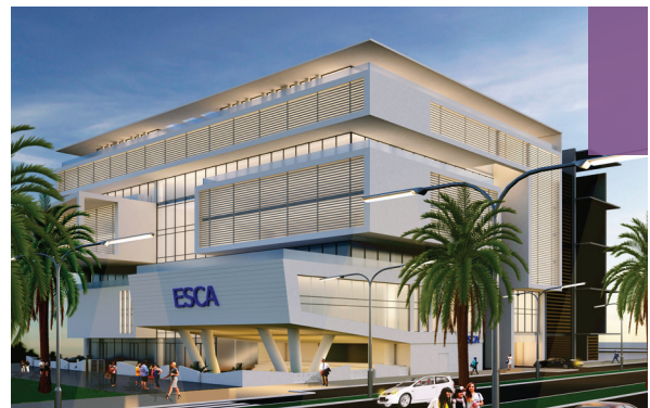
State-of-the-Art Campus Facilities